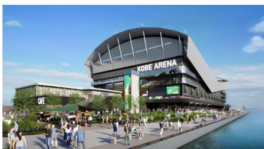
にぎわいイメージ